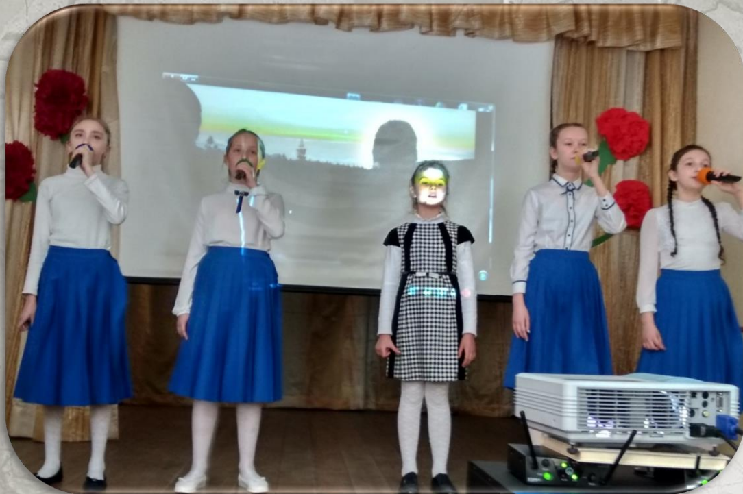
Литературно-музыкальная композиция «Общий вклад в Победу!»