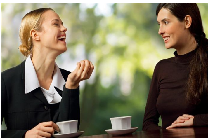
Сократ Притча «Три сита»