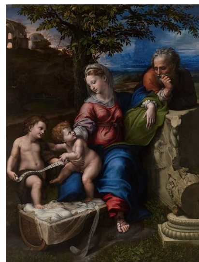
«The Holy Family»

В конце жизни художник создает полотна с еще более усложненными позами и жестами, в которых некоторые специалисты ищут и всё больше находят символизм и гностицизм. Изменяется и общий фон картин: мерцающие, более «глубокие» краски в полумраке, где фигуры пропорционально удлиняются. Некоторые из этих картин он создает совместно со своим учеником — Джулио Романо.