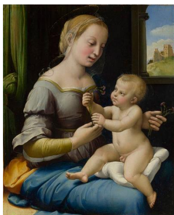
«Мадонна с гвоздикой»