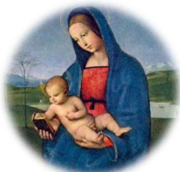
«Мадонна Конестабиле» (Madonna Conestabile).

Эта картина имеет миниатюрный размер 17,5×18 см. Традиционно считается последней работой, созданной Рафаэлем в Умбрии, до переезда в Флоренцию. Она осталась одной из двух работ Рафаэля, хранящихся в российских собраниях.