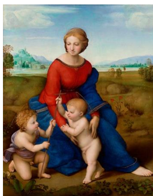
«The Madonna of the meadow»,

В флорентийский период творчества Рафаэля пишутся такие картины, как «The Holy Family with a Pal»,