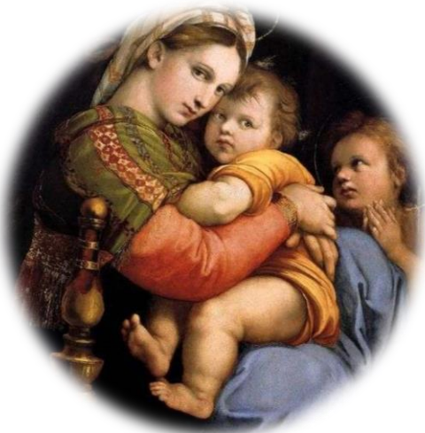
«Мадонна в кресле»