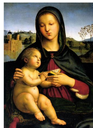
«Madonna di Pasadena»

Но, художественный гений Рафаэля вскоре превзошёл своего учителя Перудже, и уже ко второму, флорентийскому периоду его творчества, Мадонны Рафаэля начали приобретать собственный стиль. Для Мадонн этого периода были уже свойственны более сложные пейзажные фоны и образы Мадонны, где на первый план выступала эмоциональность.